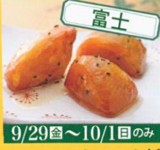
富士 9/29(金)~10/1(日)のみ 大学芋専門店 いもやるも蔵 大学芋 /460円(200g) 690円(300g)・1,150円(500g)