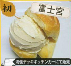
初 富士宮 海側テックキッチンカーにて販売 ドイファーム DOIFARM バジュラン /400円 (バニラ・抹茶・サツマイモ・チョコラーダ)