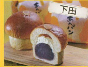
平井製菓 ハリスさんの牛乳あんぱん /206円