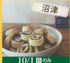
沼津 10/1(日)のみ ロタス LOTUS シナモンロール・スコンキッシュなど /240円~