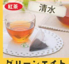
紅茶 清水 グリーンエイト 和紅茶プレミアムスイーツ 50g 1,944円