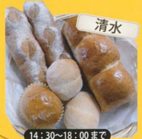
14:30~18:00まで 手作りパンの店 カセ・ラ・クルート イギリス食パン /400円(1.5斤)