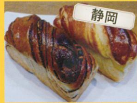
バーネ・ドルチェリア ゴット Pane Dolceria Gotto プレット各種 /300円~