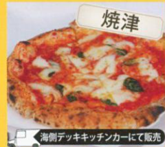
焼津 海側テックキッチンカーにて販売 ラ・バレーナ・ボランテ LA BALENA VOLANTE マルゲリータ スモール600円・ノーマル800円