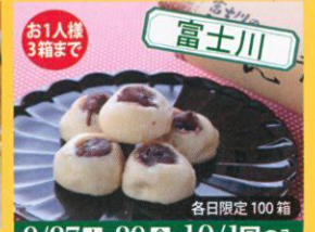
お1人様 3箱まで 富士川 各日限定 100箱 9/27(水)・29(金)・10/1(日)のみ 松風堂 富士川の小まんじゅう /670円(1箱 53個入り)