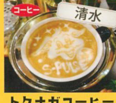
コーヒ 清水 トクナガコーヒー カフェラテ(ラテアート) /400円 ※絵柄は約12種類 お好きな柄を選択可能