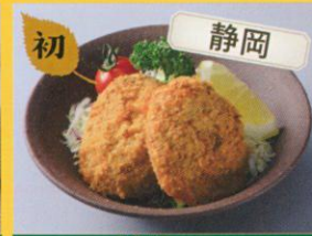
10/1(日)のみ オクシズ山の恵み市場 きよさわ里の駅 いのししコロケ /150円