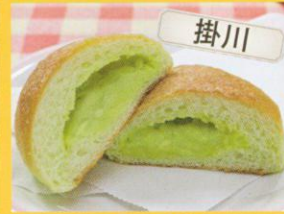
パンの郷 メロンアップ /180円