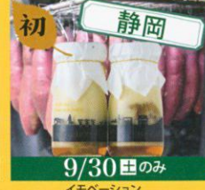
初 静岡 イノベーション Imovation まるごと焼芋プリン /350円 なめらか焼芋プリン /300円