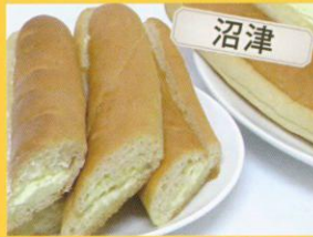
石窯パン工房 しゃんぴによん ミルクフランス /170円