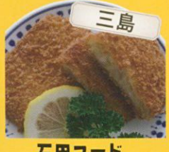
三島 石田フード みしまコロケ /162円