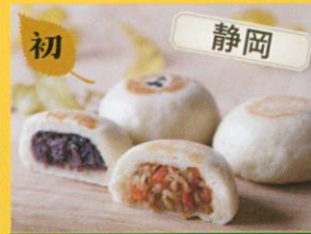
9/28(木)・30(土)のみ オクシズ山の恵み市場 玉ゆら 玉ゆらまん /150円