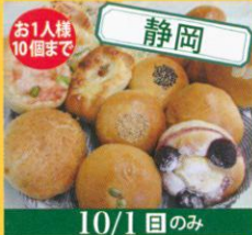
お1人様 10個まで 静岡 10/1(日)のみ 静岡県立農業高等学校 パン /100円~ ※整理券配布 9:45~