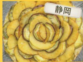
14:30~18:00まで セティボン? サツマイモとリンゴのタルト 1カット 450円