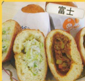
富士山麓のピロシキ専門店 3776type ピロシキ各種 /250円~