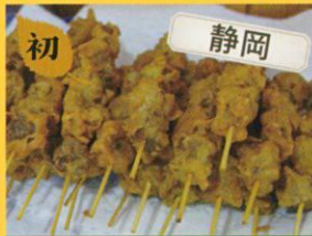
9/27(水)のみ オクシズ山の恵み市場 水見色きらく市 しみしみこんにゃく唐揚げ /100円