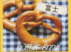
10:00~14:00まで SHION シオン バタープレッツェル /350円