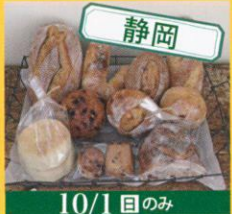
静岡 10/1(日)のみ ブレイクフィースト breffie STORE まめバケット /265円