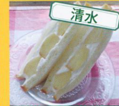
清水 9/27(水)~29(金)のみ プティパレアラメル フルーツサンド /500円