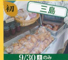
初 三島 箱根西麓野菜の甘食 /400円(5個)