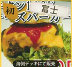
初 富士 海側テックにて販売 焼肉牡丹苑 牛肉 100%ハンバーガー /600円