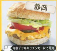
静岡 海側テックキッチンカーにて販売 ステッピンバーガー Steppin Burger ステッピンチーズバーガー /700円