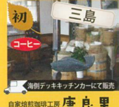
初 三島 自家焙煎珈琲工房 唐良里 自家焙煎珈琲焼きたての珈琲豆 100g×3袋 1,000円 三嶋甘藷の作りたて大学芋 1カップ 300円