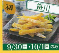
初 掛川 まるやま農場 やわらかほしいも /600円