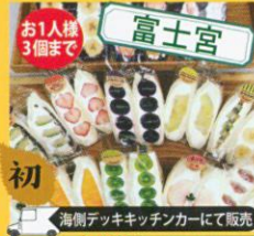
お1人様 3個まで 初 富士宮 海側テックキッチンカーにて販売 9/27(水)のみ 望月商店 ※販売券配布 9:45~ ヤオヤノフルーツサンド /380円~840円