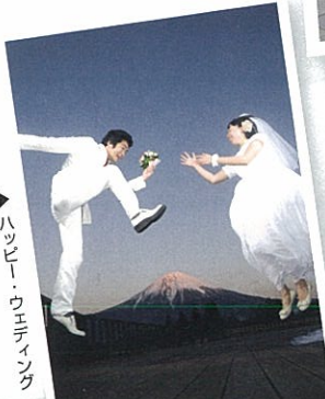
▶ハッピー・ウェディング