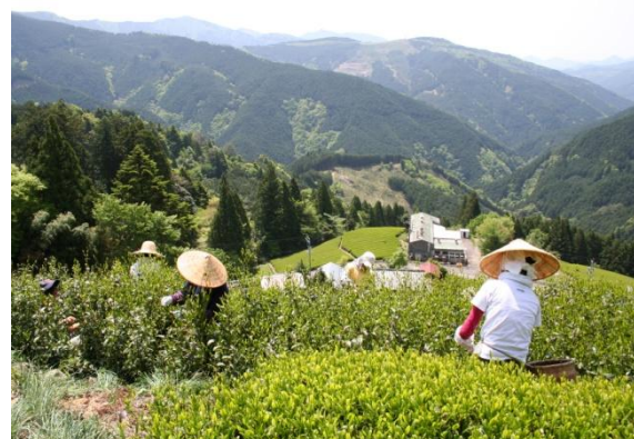
静岡市大川地区・大間からの眺望と茶摘み風景